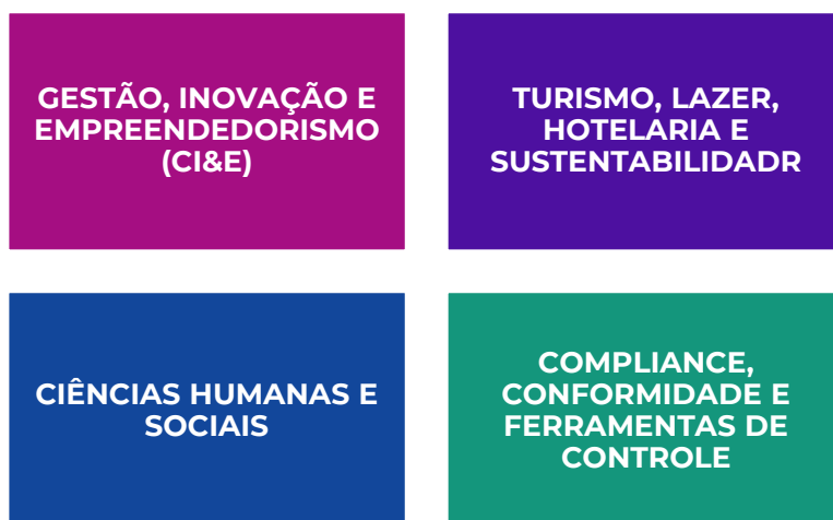
Figura 2 – Linhas de Investigação e respetivos Coordenadores

Para cada uma das 4 (quatro) grandes linhas de investigação, existirão coordenadores de linha, os quais serão nomeados pelo Conselho de Direção.