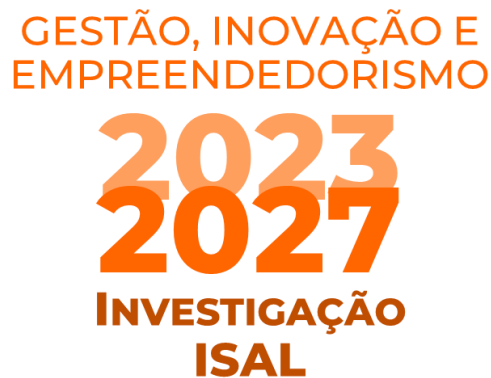
Figura 3 – Linha de Investigação Gestão, Inovação e Empreendedorismo