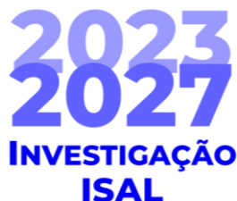
Figura 5 - Linha de Investigação Ciências Sociais e Humanas